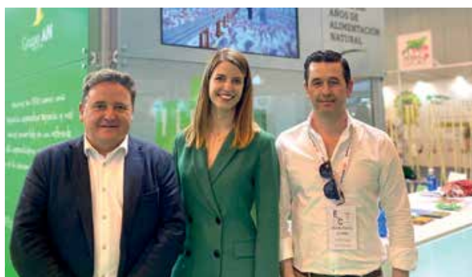
Por el espacio también pasaron representantes de empresas con las que trabaja el Grupo AN

Además de la imponente parte expositiva del certamen, Figan 2023 ha servido como punto de encuentro ineludible donde se tratan los temas de interés del sector, así como sus tendencias, retos y transformaciones futuras, a través de un ambicioso programa de jornadas técnicas, con más de 50 actividades y casi 40 organizadores.