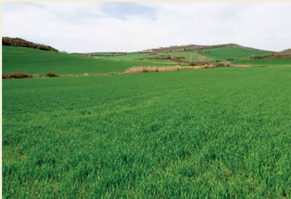
Cereal en el valle de Yerri, Navarra