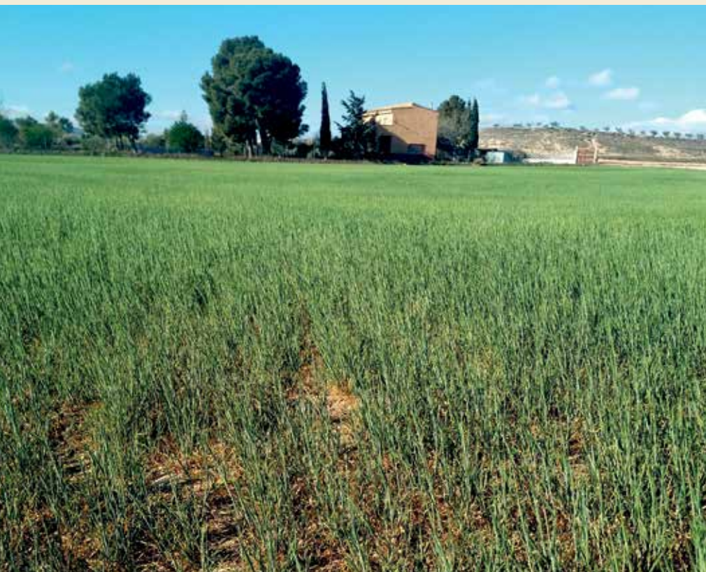
Campo de cereal en Lécera, Aragón