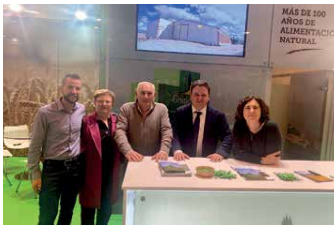
Profesionales de diferentes áreas del Grupo AN atendieron a los visitantes