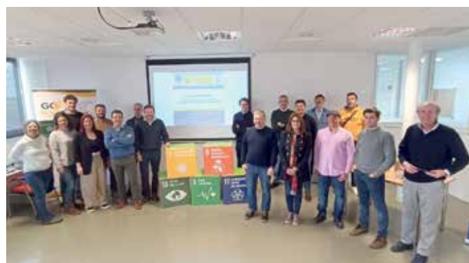
Jornada de presentación de resultados y conclusiones del Grupo Operativo MaízSostenible

El Grupo AN ha colaborado en este proyecto liderado por Vertex Bioenergy con la Universidad de Sevilla (Grupo Investigación Smart Biosystems Lab), el Instituto Tecnológico Agrario de Castilla y León (ITACyL), Corteva Agriscience, TimacAGRO España, CU WG Spain S.A. (Control Unión), todos ellos socios del grupo operativo, y con colaboradores como Artica Ingeniería e Innovación (artica+i), el Centro de Investigaciones Energéticas Medioambientales y Tecnológicas (CIEMAT), la Asociación Española del Bioetanol (BIO-E) y la Confederación Española de Fabricantes de Alimentos Compuestos para animales (CESFAC).