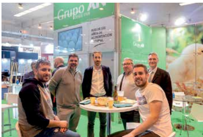
El stand del Grupo AN, punto de encuentro entre ganaderos, agricultores, clientes y socios