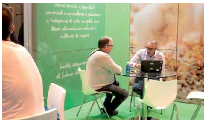
Los visitantes pudieron resolver dudas con parte del equipo de la Correduría de Seguros