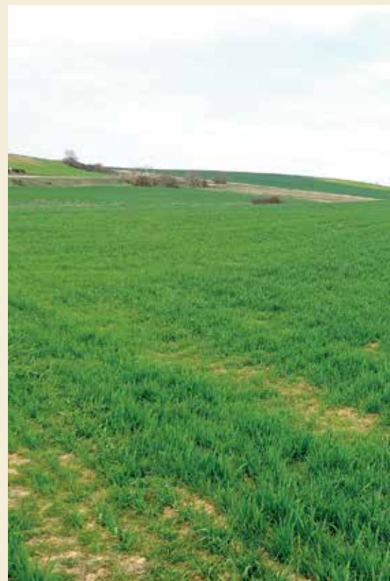
Campo de cereal en Villada, Palencia

Por último, en Aragón se prevé una disminución importante de los cultivos de verano: "Creemos que puede rondar entre un 40% y un 50% debido a los cupos de agua", considera el director comercial. "Ha llovido muy poco y ha nevado lo justo, por lo que los pantanos no van a terminar de llenarse y la reserva de nieve del Pirineo es muy escasa. Faltarán agua y habrá que orientar ese recurso a cultivos con menor demanda de agua, como puede ser el girasol".