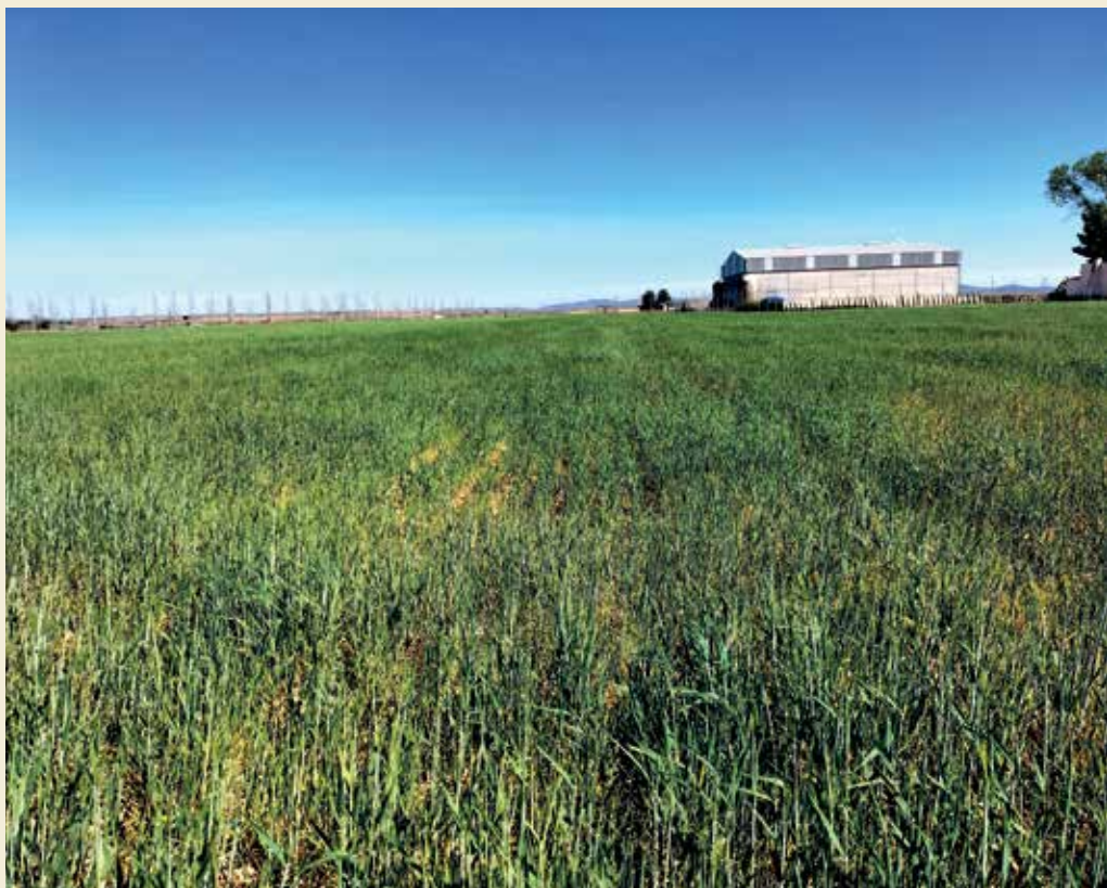
Cereal en la zona de Membrilla y Manzanares, Ciudad Real

se encuentran en niveles aceptables para las zonas de regadío, pero dependerá de que las temperaturas sigan siendo benignas para adecuar correctamente el volumen de agua por hectárea hasta el final de la campaña.