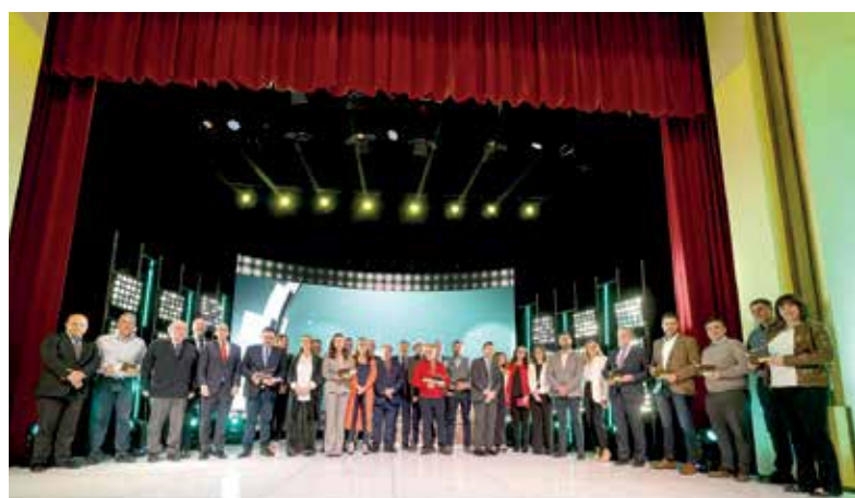
Foto de grupo de las personas premiadas y de los patrocinadores

para la economía de Castilla y León. El Grupo AN patrocina desde hace varios años los Premios Surcos, considerados en el sector como los Oscar del campo, y una sección dentro del programa semanal que da nombre a estos galardones en Castilla y León Televisión.